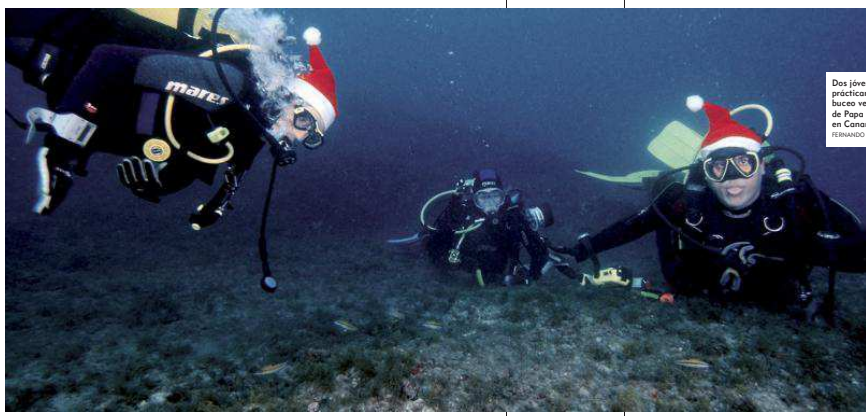
Dos jóvenes practican el buceo vestidos de Papa Noel en Canarias.