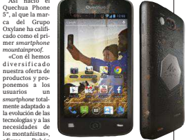
Vista frontal y trasera del nuevo Quechua Phone 5" y su menú de inicio. G.U./CAM-

Otra de las exigencias del montañista a la que responde el Quechua Phone 5" es la necesidad de contar con una gran autonomía. Cuenta con una batería de 3500mAh, de larga duración en uso GPS. Finalmente, está equipado con un altímetro-barométrico para ofrecérselo.